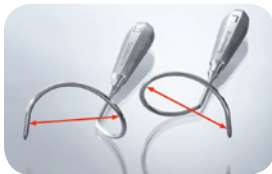
DynaMesh®-IST03 Durchmesser: 5 cm